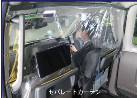
セパレートカーテン